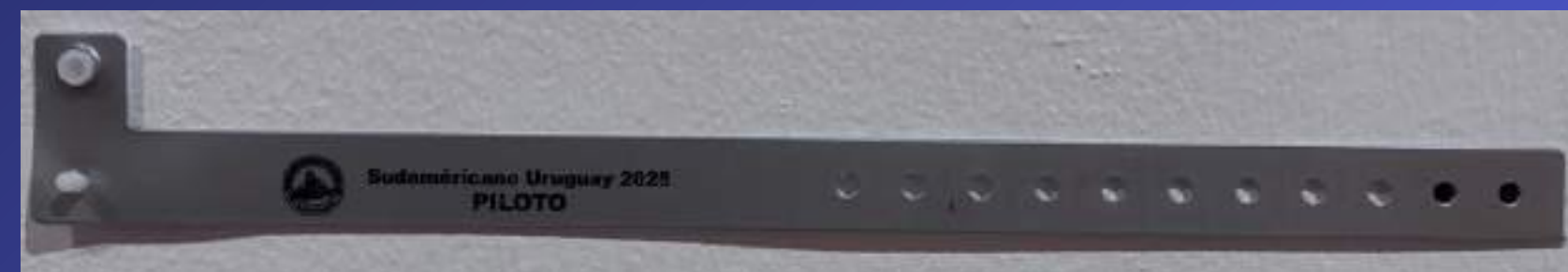
Pulsera para Piloto