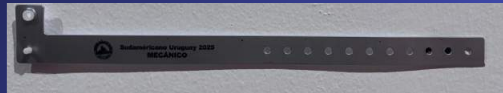
Pulsera para Mecánico

El mismo se podrá realizar solo con la pulseras que se muestran: