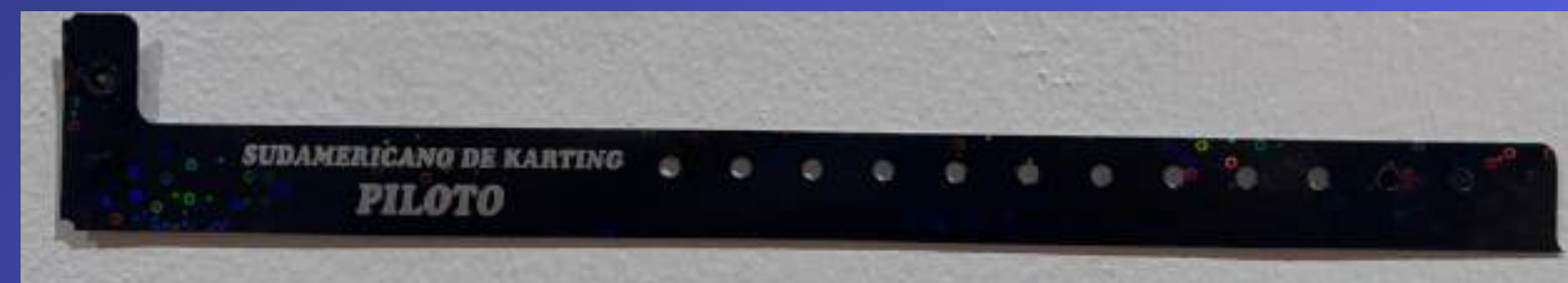
Pulsera para Jefe de Equipo